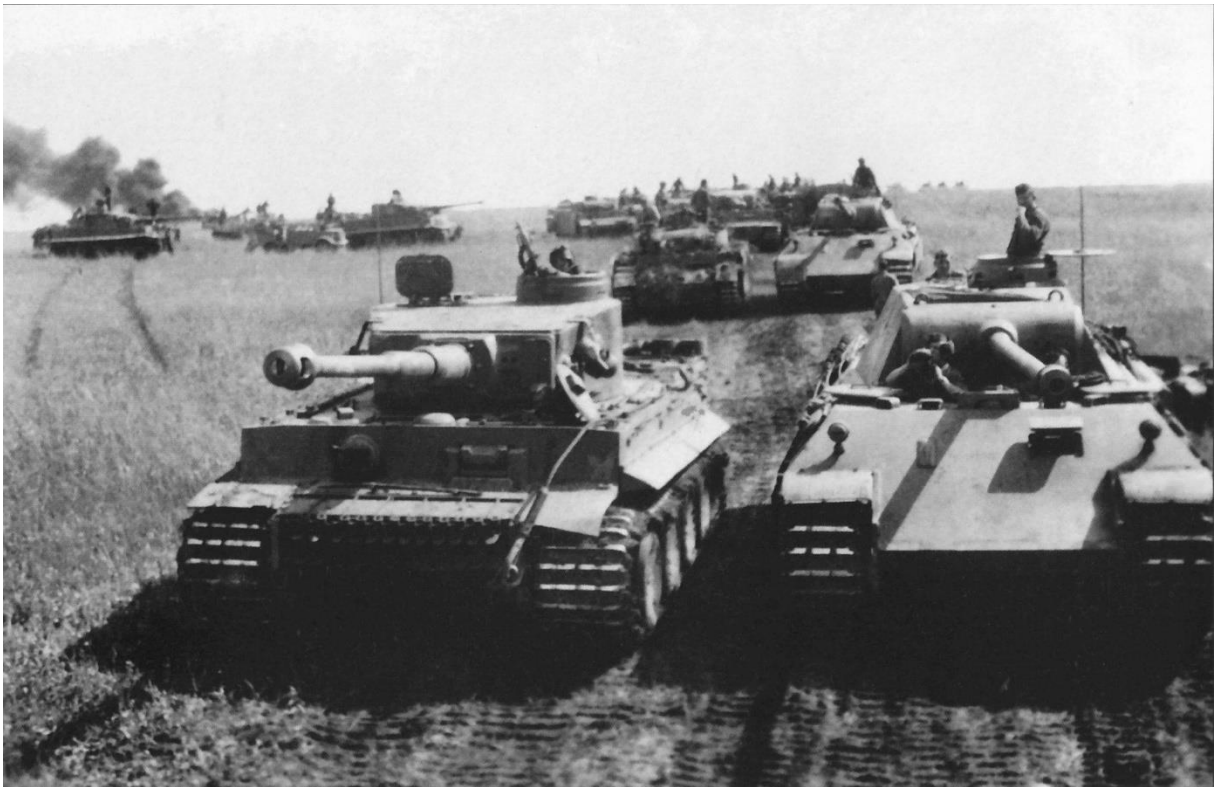
Panther der Pz Abt 51 neben Tigern der 13.Kp Pz.Rgt. GD - Kursk 1943

Ernst: Ich war sowohl in der Tiger- als auch in der Panther-Kompanie. Für mich war der Panther dem Tiger überlegen, weil er leichter war und mehr Komfort bot. Der Panzer IV ist knapp dahinter, aber der Panther war geräumiger und komfortabler. Er hatte eine spezielle Aufhängung, die wie Reifen wirkte; er war nicht so holprig zu fahren. Frühe Mängel wie Pannen und Brände wurden behoben, so dass er 1944 eine gefürchtete und beeindruckende Waffe war. Das Reich war schon früh auf schwache Panzer wie den Panzer II und III angewiesen, um es mit den besser bewaffneten sowjetischen Panzern aufzunehmen. Es war so schlimm, dass wir sogar einmal erbeutete T-34 einsetzen mussten. Der Panzer IV mit langem Lauf war bis 1942 nicht verfügbar, also mussten wir uns damit begnügen. Der Ivan hat uns wirklich überrascht, als wir auf massive T-34-Angriffe trafen und nicht viel hatten, um sie aufzuhalten. Die Tapferkeit der Fußsoldaten ist unübertroffen, denn sie schalteten einen nach dem anderen mit Granaten und erbeuteten Molotow-Bomben aus. Als die Panther kamen, waren wir in jedem Gefecht im Vorteil. Das Problem war nur, dass sie ausfielen oder ihnen die Granaten ausgingen. Die Abschussquoten stiegen enorm und in einigen Fällen wurden ganze Brigaden von einem einzigen Panther-Zug ausgelöscht.