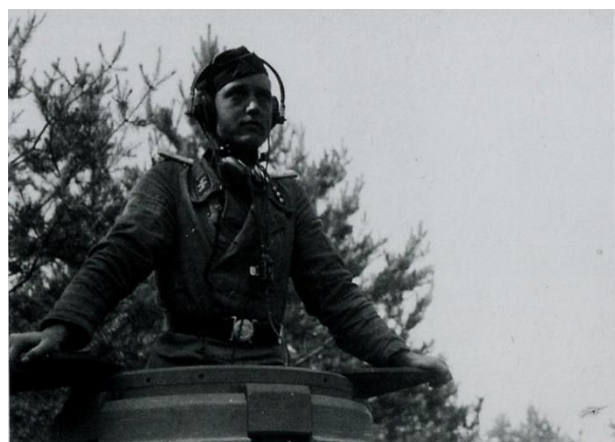
Panzer IV und Zugführer der Frundsberg in Pommern 1945