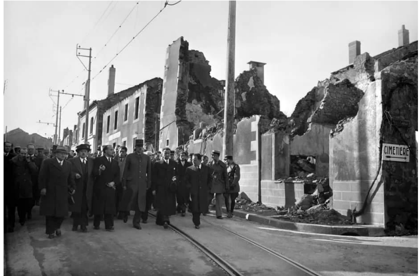
Oradour sur Glane, Besuch von General de Gaulle, 28.11.1944

Es mag einzelne SS-Männer gegeben haben, die gegen unsere Regeln und die Regeln des Krieges verstießen, aber das ist kein Spiegelbild der gesamten SS. Ich habe große Vorbehalte gegenüber all den Gräueltatsgeschichten, die immer häufiger in den Medien auftauchen. Wir haben in zahlreichen Schulungen strikte Anweisungen gegeben, immer freundlich und barmherzig zu den Unschuldigen zu sein, die den Krieg genauso wenig wollten wie wir. Ich erinnere mich noch gut an die Zivilisten, die zu uns kamen, um uns um Hilfe zu bitten oder um Gegenstände zu verkaufen. In Russland wurden wir als Befreier begrüßt und hochgeschätzt. Als wir uns zurückzogen, folgten uns ganze Bevölkerungsgruppen, um dem sowjetischen System zu entkommen. Während der Rückkehr des Reiches in den Osten rettete einer meiner Männer ein polnisches Kind vor dem Ertrinken, es rutschte in einen Kanal und er sprang hinein, um es herauszuziehen, bevor es unterging. Wir mussten oft Kinder verjagen, die unsere Waffen und