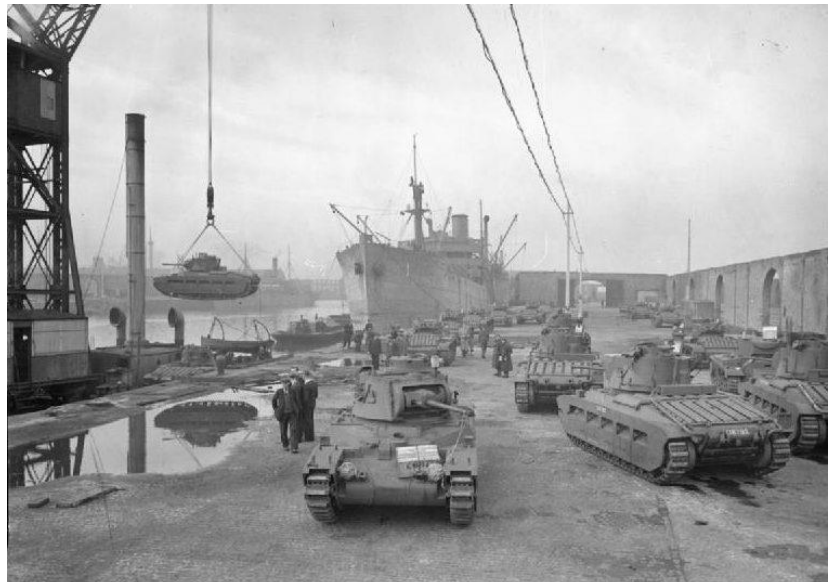
Verladung des Panzers „Matilda“ für die UdSSR in den Docks von Liverpool. 17. Oktober 1941

Deutschland hatte die besten Optiken, so dass wir oft zuerst und genauer schießen konnten. Wir verbrachten viele Stunden auf dem Schießstand, um das Bewegen und Schießen zu üben. Meine Crews und ich wurden sehr gut darin und gewannen so manche Schlacht. Ich besitze die höhere Klasse des Panzerabzeichens [ Panzerkampfabzeichen in Silber für 25 Einsätze ] und das Eiserne Kreuz, was ein Zeugnis für die Schlachten ist, an denen wir teilnahmen. Wir waren oft in der Unterzahl und deshalb sind unsere Abschusszahlen hoch. Der Ivan hatte einen unerschöpflichen Vorrat an Panzern, sowohl amerikanische als auch eigene. In einem Gefecht hatten wir es mit Shermans, Crusaders, Lees, T-34 und T-26 zu tun, und das alles auf einmal. Die Alliierten hielten Russland 1943 im Krieg, es lag in den letzten Zügen, aber das Glück war uns nicht hold.