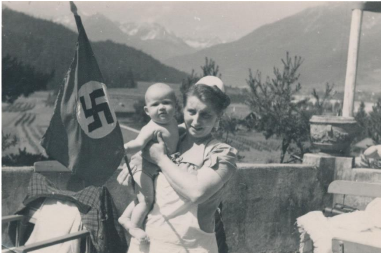
Originalfoto, das eine "Lebensborn"-Schwester mit einem kleinen Kind in den Armen zeigt. Auf der Rückseite ist mit Bleistift ein unübersetzter Vermerk mit dem Datum 30. Februar 1940 angebracht.

Um den genetischen Niedergang zu korrigieren, wurden SS-Gesetze erlassen, nach denen der Ehepartner seine rassische Reinheit nachweisen musste, indem er seit mehreren Generationen kein Mischblut mehr hatte. Um in die SS aufgenommen zu werden, musste sich der SS-Mann demselben Test unterziehen. Den Paaren wurden kostenlose Kurse angeboten, um ihnen zu zeigen, wie man eine glückliche Ehe führt und mit Problemen umgeht. Ein glückliches Zuhause für die Kinder war die Priorität. Dieses Büro half auch SS-Familien bei der Adoption von Kindern, die aus dem einen oder anderen Grund freiwillig abgegeben worden waren. Ziel war es, dafür zu sorgen, dass eine SS-Familie jede Unterstützung erhielt, die sie brauchte, um glücklich und sicher zu sein. Auch die Lebensborn-Heime gehörten zu diesem Büro. Ehefrauen und unverheiratete Frauen, die schwanger waren, konnten kostenlos kommen, um das Baby zu bekommen, und es war ein ruhiger Erholungsort. Während der Polenkrise beaufsichtigte das Büro die Evakuierung von Deutschen, die 1938-1939 vor der polnischen Verfolgung flohen.