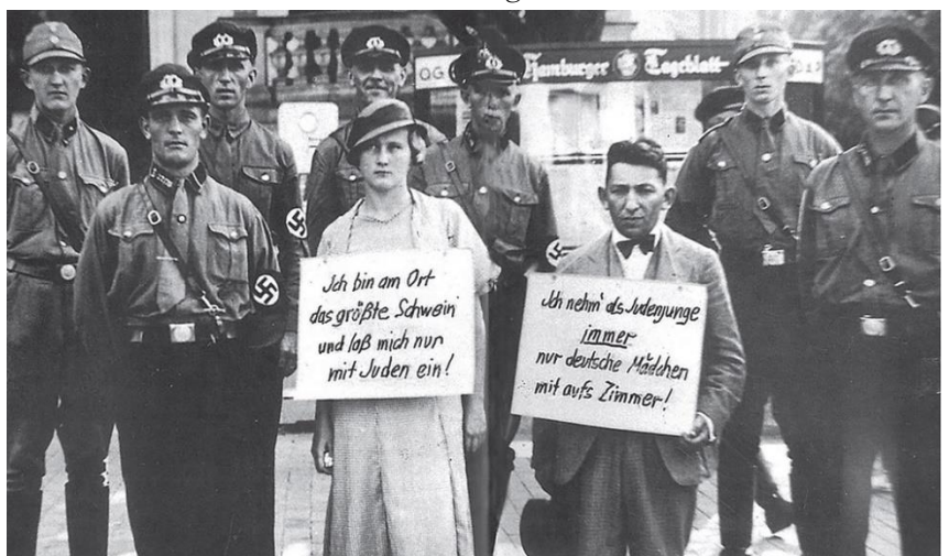
Ein jüdischer Kinobesitzer und seine Freundin müssen sich vor dem Hotel „Vierjahreszeiten“ in Cuxhaven im Juli 1933 – weit vor Inkrafttreten der Nürnberger Gesetze – die öffentliche Zurschaustellung als sogenannte Rassenschänder gefallen lassen.

Ernst: Es war ein großes Büro, das mehrere Funktionen hatte. Die wichtigste war natürlich die rassische Gesundheit Deutschlands. [Walther] Darré und Himmler sahen, dass in der gesamten westlichen Welt ein Niedergang stattfand, von dem sie glaubten, er sei auf einen jüdischen Plan zurückzuführen. Dieser Niedergang war rassistisch bedingt und wurde durch die Förderung der Rassenmischung herbeigeführt. Vor allem in den germanischen Ländern wollten Marxisten und jüdische Akademiker Arbeiter aus Afrika, Arabien und dem Osten ins Land holen. Sie kämpften für Gesetze zur Abschaffung jeglicher Rassentrennung und förderten die Vermischung mit Propaganda. Dies geschah im französisch kontrollierten Saarland, wo sie Afrikaner stationierten und sich daran erfreuten, dass deutsche Frauen, die hungerten, ihnen zum Opfer fielen. Es wurden Gesetze durchgesetzt, um jeglichen Unmut darüber zu unterbinden. Von arabischen Invasionen, die Europas Blutlinien verdarben, bis hin zu den Juden aus dem Osten, die nach Deutschland strömten, war das unvermischte