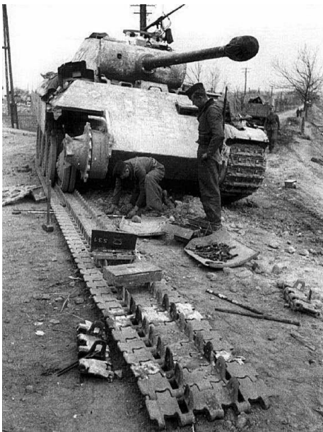
Wartung Kette eines PzKpfw.V Panther Ausf. A, II./SS-PzRgt. 5 'Wiking', Kovel 1944

gelangten in die Kirche und entzündeten dort etwas Schlimmes. Schlimmstenfalls hat ein Widerstandskämpfer etwas ausgelöst, das die Kirche schnell in Brand gesetzt hat. Kein deutscher Soldat hat die Kirche in Brand gesteckt, davon bin ich überzeugt.